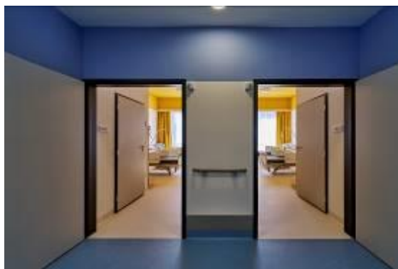
Nová budova D pro oddělení dlouhodobé lůžkové péče a oddělení lůžkové rehabilitace Nemocnice Mělník