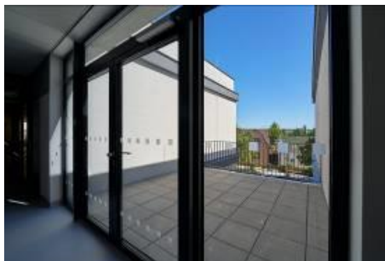
Nová budova D pro oddělení dlouhodobé lůžkové péče a oddělení lůžkové rehabilitace Nemocnice Mělník

„Nová budova nabízí pro obě oddělení moderně vybavené prostředí, které nám umožní zavést do běžné praxe trendy současnosti jako je například virtuální realita, kterou ocení při cvičení a aktivizaci pacienti na obou odděleních. Prioritou však stále zůstává důraz na individuální péči poskytovanou dle potřeb každého pacienta, která je zajištěna 24hodin denně. V loňském roce nelékařský tým ODLP