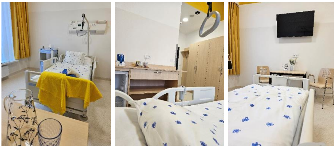
Nadstandardní jednolůžkový pokoj oddělení rehabilitace

samotných pacientů ale i zaměstnanců. Zároveň se prostory dají využít i pro práci s několika pacienty společně.