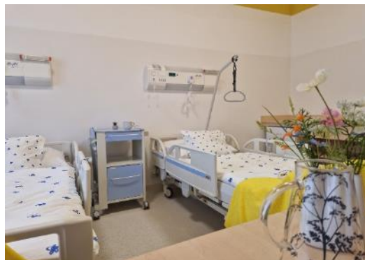
Dvoulůžkový pokoj oddělení rehabilitace