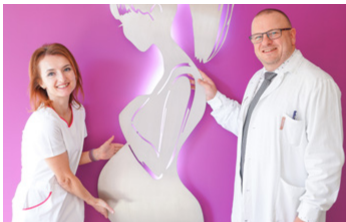
Primář GPO s vrchní sestrou