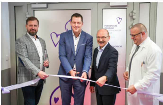
Oficiálně otevřeno! Račtě vstoupit.

Začátkem nového roku se v Mělníku konalo slavnostní otevření nově zrekonstruované porodnice. Za přítomnosti zástupců města, kraje, nemocnice i společnosti VAMED MEDITERRA proběhly prohlídky nadstandardních pokojů a porodních sálů. Bylo tak ukončeno náročné období stavebního ruchu. Poděkování patří všem zaměstnancům za jejich trpělivost a ochotu podílet se na vzniku nové Porodnice Mělník.