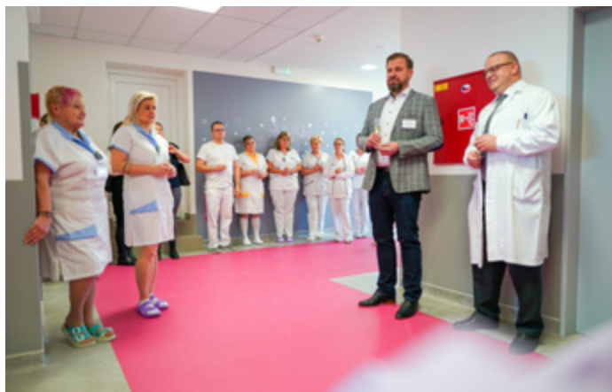
Při slavnostním otevření nesměli chybět ani zaměstnanci porodnice