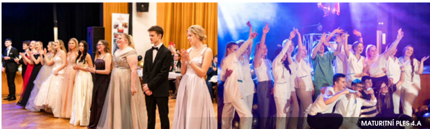
MATURITNÍ PLES 4.A

Z akcí, které nás teprve čekají, bychom rádi zmínili „Den bezpečnosti silničního provozu 26. pluku velení, řízení a průzkumu“ se strategií BESIP, který proběhne 16. 4. 2024 v době od 9:00 do 12:00 v prostoru Jaselských kasáren ve Staré Boleslavi. Součástí akce bude i projekt Ministerstva obrany ČR. Naši studenti zde budou prezentovat poskytování první pomoci a asistovat u dynamických ukázek zásahu složek IZS. Z dalších akcí uvádíme celostátní soutěž v poskytování laické první pomoci pro střední zdravotnické školy z celé republiky, která proběhne 23. až 24. 4. 2024 ve Lhotce u Mělníka.