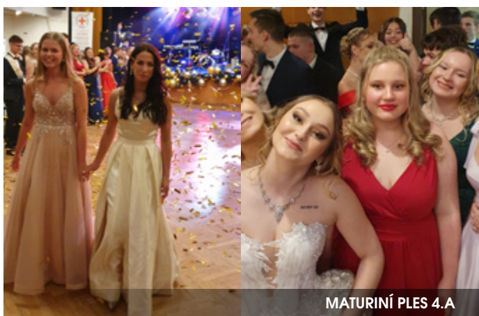
MATURITNÍ PLES 4.A