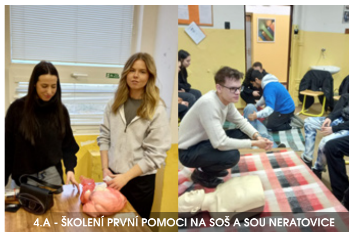
4.A - ŠKOLENÍ PRVNÍ POMOCI NA SOŠ A SOU NERATOVICE