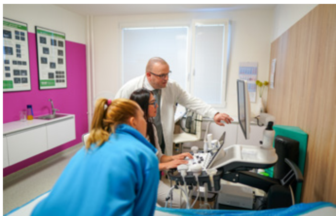
3D ultrazvuk v Porodnici Mělník