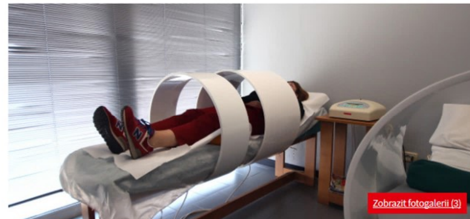
Magnetická terapie je jednou z účinných metod

To se mi líbí Sdílet Budte první mezi svými přáteli, komu se to líbí.