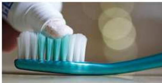
Zubní pasta a kartáček na zuby

obrali jsme, co paradentózu způsobuje, stli je dědičná a jak řešit léčbu. Dozvěděli e se, zdali pomáhají jako prevence speciální kartáčky nebo pasty na zuby.