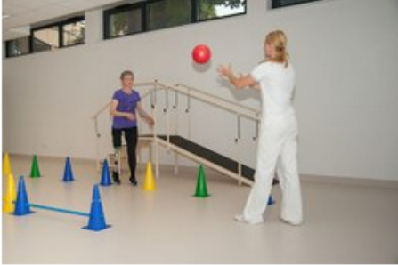
Lidé po amputaci se znovu učí chodit

Lékaři v Česku amputují ruku nebo nohu každoročně několika tisícům lidí.