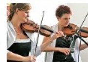
PŘI SLAVNOSTNÍM otevření hrál smyčcový kvartet.