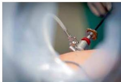
Laparoskopie patří mezi moderní chirurgické techniky.

Doktor Jaroslav Tvarůžek se chirurgii věnuje od 90. let, zkušenosti získal nejen u nás, ale i v zahraničí. Byl mezi prvními českými chirurgy, kteří si osvojili miniinvazivní operační přístupy pomocí tehdy nové laparoskopické techniky.