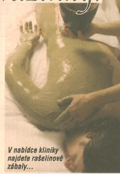
V nabídce kliniky najdete rašelinové zábaly...